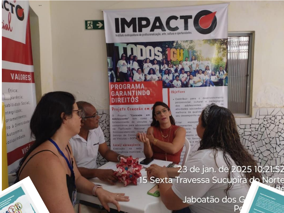
23 de jan. de 2025 10:21:52 15 Sexta Travessa Sucupira do Norte Piedade Jaboatão dos Guararapes - PE