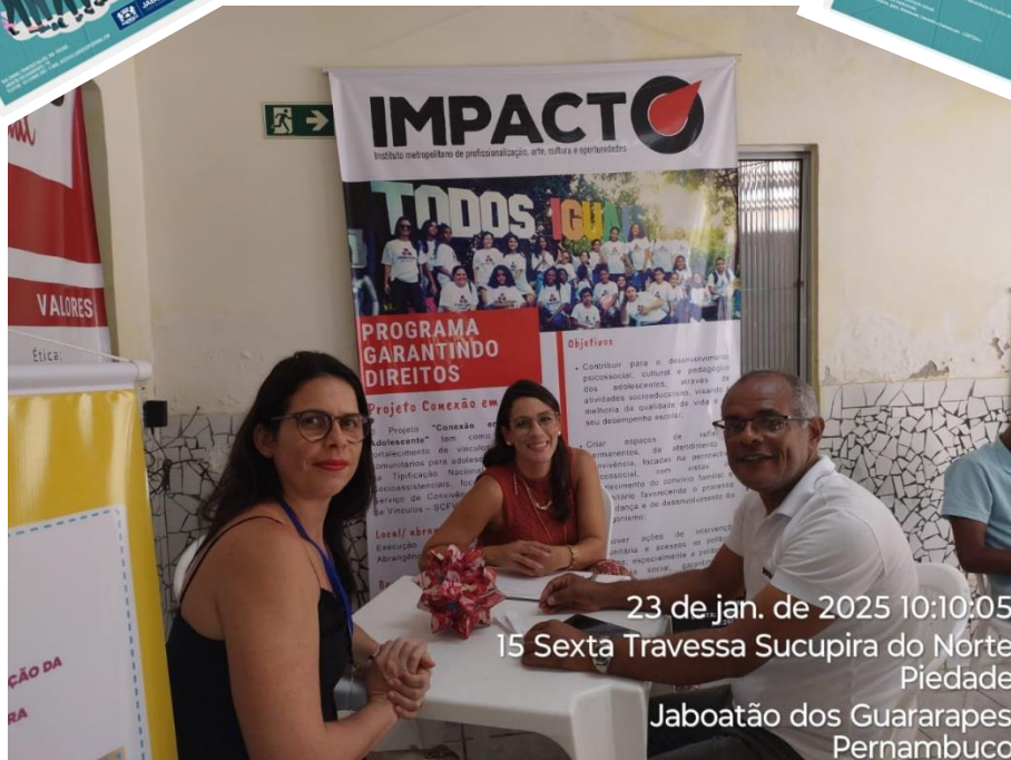
23 de jan. de 2025 10:10:05 15 Sexta Travessa Sucupira do Norte Piedade Jaboatão dos Guararapes Pernambuco